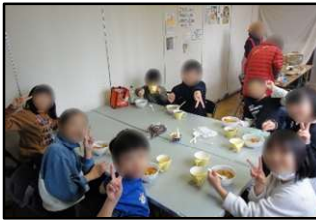
おいしかったです！