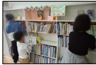
図書室の本を揃えます