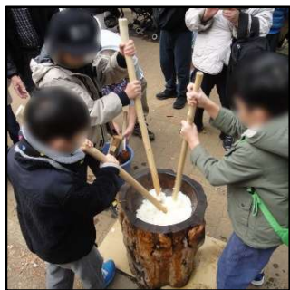
もち米を棒で突いて