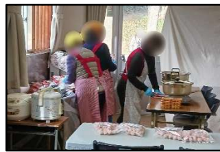
カレーを作ってもらって