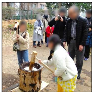
杵でペタンペタン