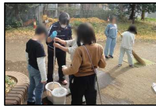
マットもきれいにして