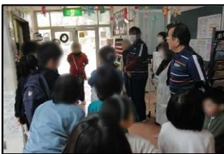
今日の掃除場所は