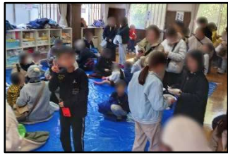
醤油やお汁粉で食べました