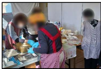
機械でもお餅を作って