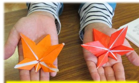
折り紙で秋を表現☆