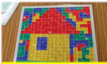
ブロックスでお家を作りました