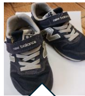
18センチ・紺色 ニューバランス