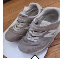
19.5センチ・グレー ニューバランス