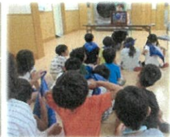
月に1度の読み聞かせ 雨でも元気です♪