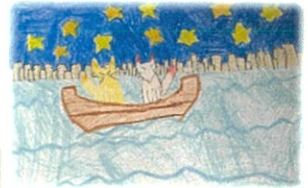
↑ロマンティックなイラスト ←アンキロザウルスがカッコよく描けています