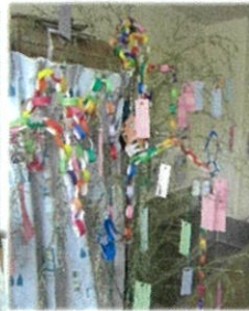
七夕行事！短冊や飾りを みんなで作りました☆