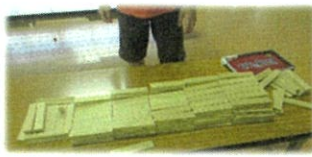
大がかりな作品に挑みます